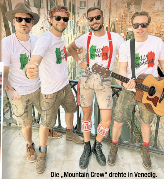
Die „Mountain Crew“ drehte in Venedig.