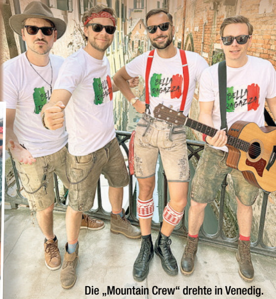
Die „Mountain Crew“ drehte in Venedig.