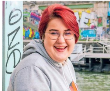
Schröcker 2023 und 2022 PAJMAN, KK

sen: „Ich bin stark, ihr habt es nicht geschafft, mich zu schwächen.“